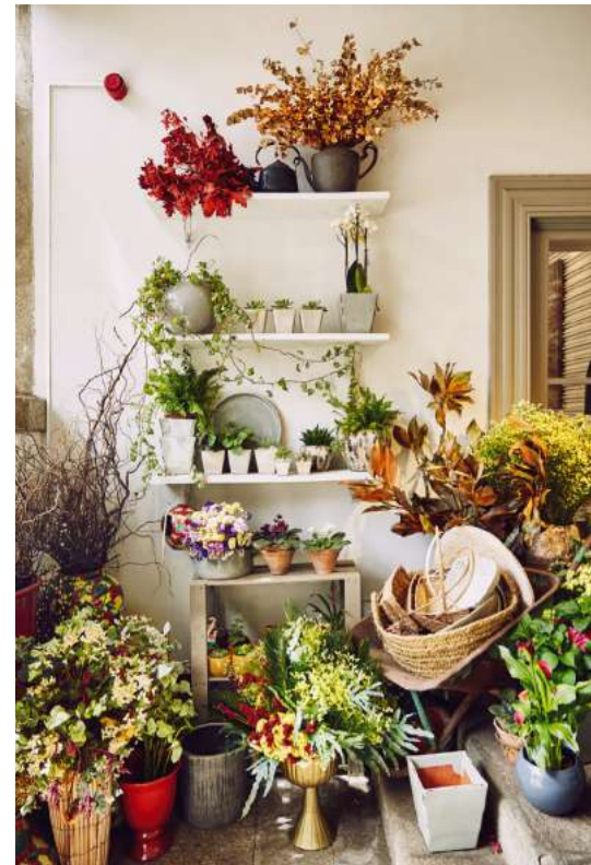
Sobre estas líneas, la floristería Bloom, Flores e Eventos ( bloomflores.com ). A la izquierda, el tranvía de la línea 22, perfecto para un recorrido turístico por el corazón de la ciudad. Abajo, mosaico de azulejos en la estación de São Bento.