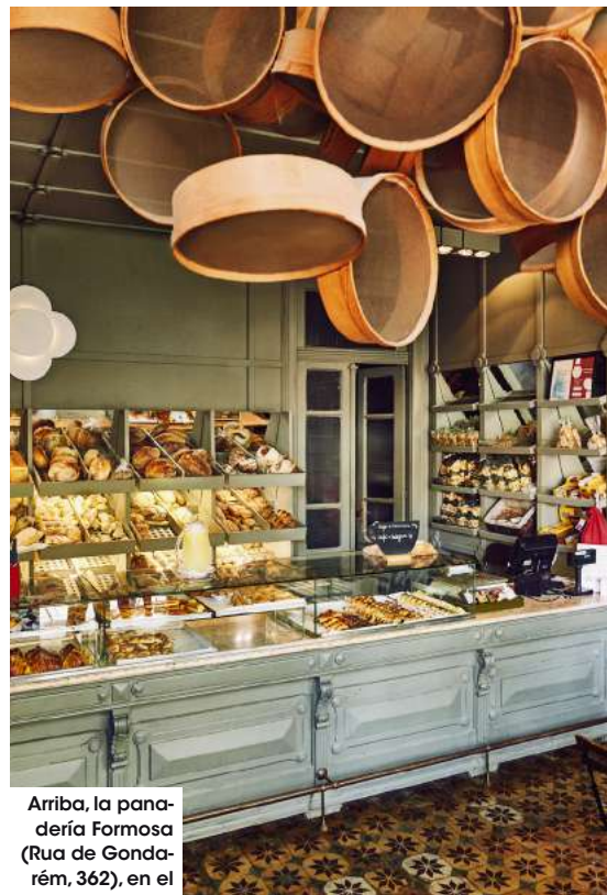
Arriba, la panadería Formosa (Rua de Gondarém, 362), en el barrio de Foz, una de las más antiguas del país. Abajo, cereales en Saboriccia.