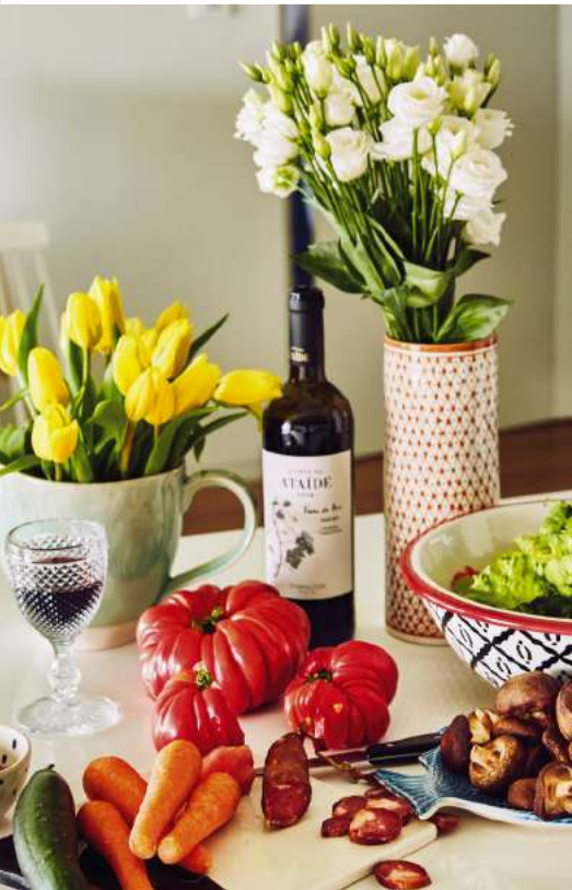
Arriba, jarra, jarrón y ensaladera de Slow Love (slowlove.es), flores de Bloom, Flores e Eventos, copa de Vista Alegre para Robalo (robalo-sa.com) y vino tinto Quinta do Ataíde (symington.com). Abajo, gallo de cerámica de Robalo, jarra de Slow Love, flores de Bloom, Flores e Eventos, conservas de Saboriccia y vino dulce de Oporto.