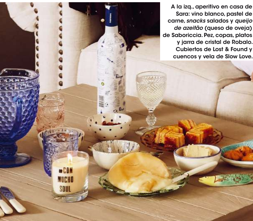
A la izq., aperitivo en casa de Sara: vino blanco, pastel de carne, snacks salados y queijo de azeitão (queso de oveja) de Saboriccia. Pez, copas, platos y jarra de cristal de Robalo. Cubiertos de Lost & Found y cuencos y vela de Slow Love.