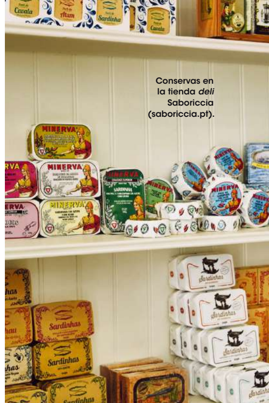
Conservas en la tienda deli Saboriccia ( saboriccia.pt ).