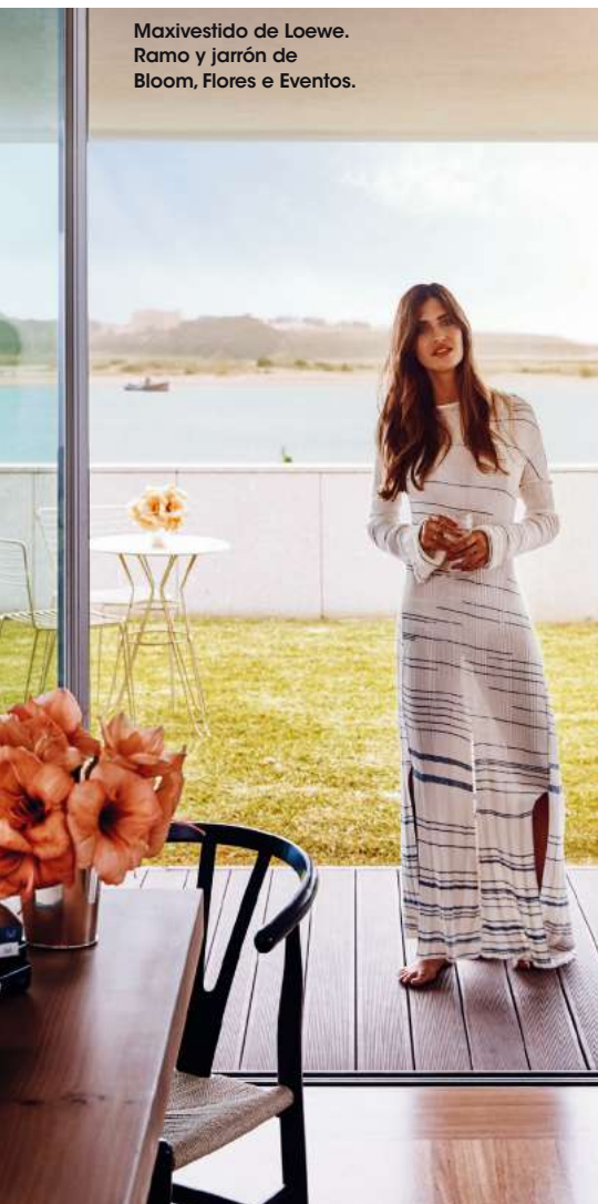
Maxivestido de Loewe. Ramo y jarrón de Bloom, Flores e Eventos.

» la zona adonde siempre llevan a los amigos que los visitan. «Vamos paseando, lo que me parece una maravilla. Uno es una petisqueira , Casa de Pasto da Palmeira (Rua do Passeio Alegre 450), para mí, de los mejores lugares de los alrededores. Me gusta por la calidad de la comida y la originalidad de los platos; preparan unos rolhos de frango –pollo– para mojar con salsa de mango exquisitos. Y el cevadoto , que yo he descubierto aquí. Está riquísimo. Se trata de una especie de cereal que cocinan tipo risotto , a los cuatro quesos o con verduras. Sí, me vuelve loca», admite. No hay que olvidar el postre estrella de la casa, el Bolo de Sandra , una tarta de mousse de chocolate picante con un contraste de sabores muy interesante. El segundo lugar es la Mercearia do Miguel (Rua do Passeio Alegre, 130), una mezcla entre café y colmado. «Todo allí es ecológico: las ensaladas las verduras, las frutas, los zumos... Es una de mis segundas casas. ¡Ya tengo varias aquí!», bromea. También procura acercarse con los suyos a Praia da Luz ( praiadaluz.pt ), un restaurante en la costa «con unas puestas de sol increíbles», y a Leça da