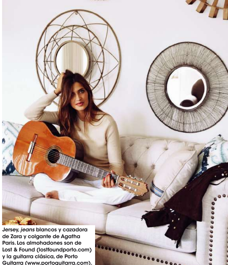
Jersey, jeans blancos y cazadora de Zara y colgante de Agatha Paris. Los almohadones son de Lost & Found ( losfoundporto.com ) y la guitarra clásica, de Porto Guitarra ( www.portoguitarra.com ).