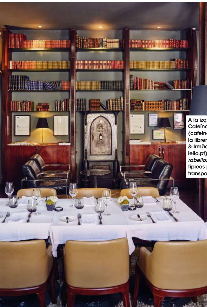
A la izquierda, restaurante Cafeína, en Foz (cafeina.pt). Arriba, la librería Lello & Irmão (livrariavello.pt). Debajo, rabellos, barcos típicos para transportar vino.